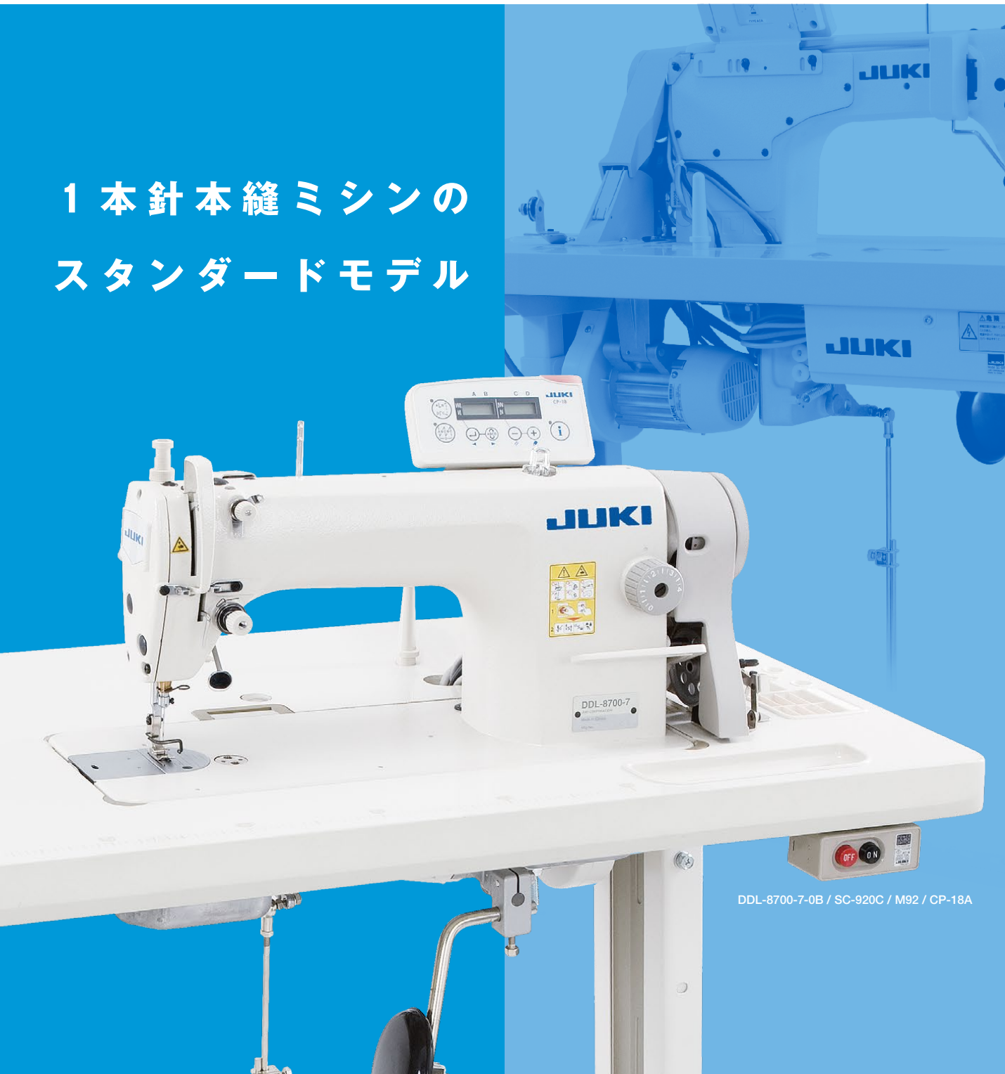
DDL-8700-7-0B / SC-920C / M92 / CP-18A