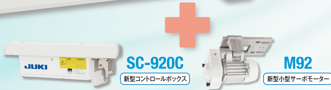
SC-920C 新型コントロールボックス