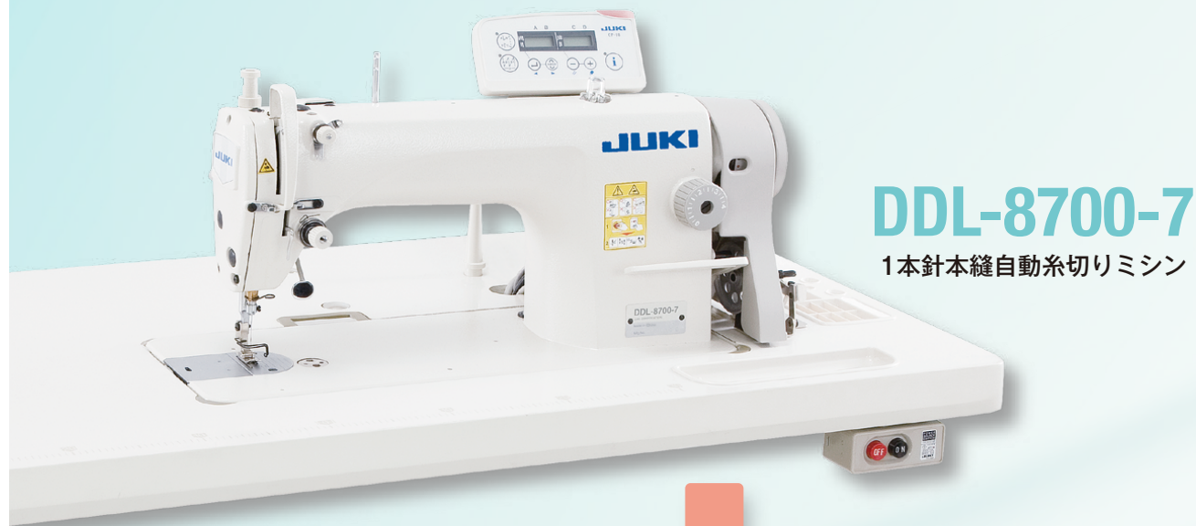
DDL-8700-7 1本針本縫自動糸切りミシン