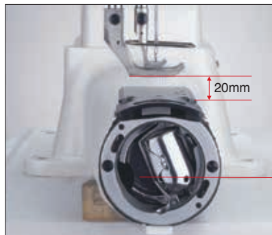
半回転シャトル大釜

半回転シャトル大釜の採用により下糸交換頻度が減少します。太番手糸を使用する極厚物縫製には最適です。