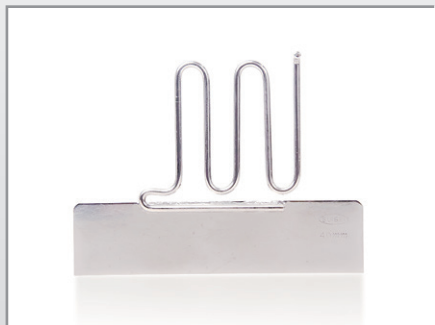
テープ案内ガイド TG-40, TG-60

テープサイズが最大40mmまで対応のTG-40と最大60mmまで 対応のTG-60の二種類あります。