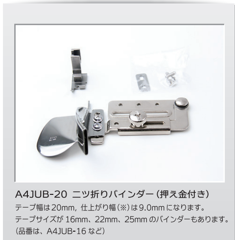
A4JUB-20 ニツ折りバインダー (押え金付き) テープ幅は20mm, 仕上がり幅(※)は9.0mmになります。 テープサイズが16mm、22mm、25mmのバインダーもあります。 (品番は、A4JUB-16 など)