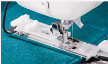
独自のセンサーで送りを補正

独自のセンサー方式を採用し、生地や段部の影響による送り詰まりを抑えたボタン穴かがりを実現。形状、ピッチ、種類にこだわりを持ち、美しさを追求。従来に比べ品質が格段にレベルUP。