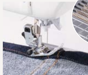
厚めのデニム 折り伏せぬいの3つ折り

特殊銅材を使用した送り歯と改良された押え構造を最適化することで送り力が大幅に向上。従来では難しかった折り目が重なった裾上げ時の極度な段差も難なく乗り越えが可能。