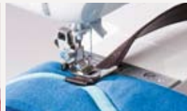
分厚いバッグの取っ手もぬい詰まりなし