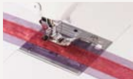
極薄物もぬい縮みなし