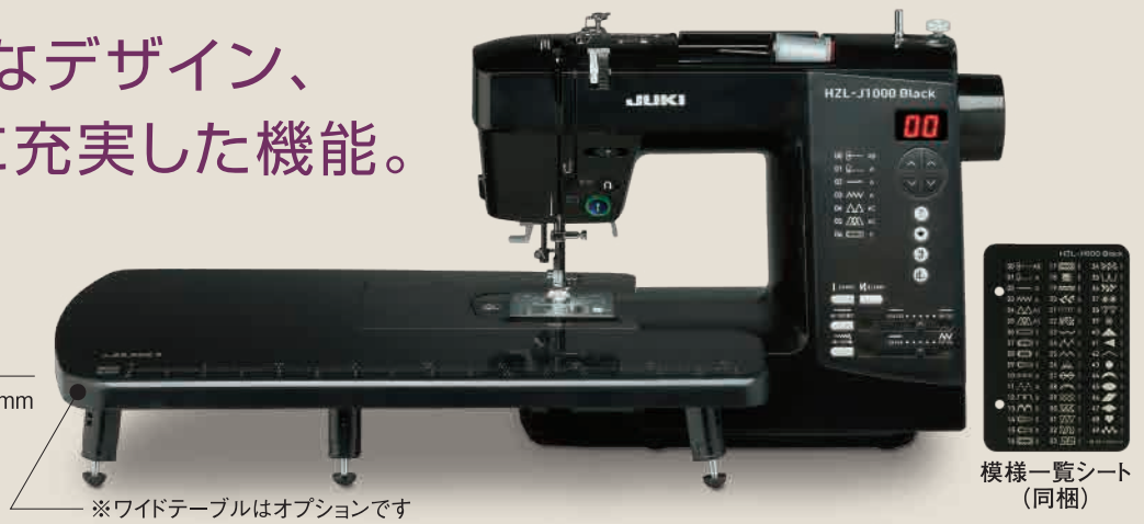
※ワイドテーブルはオプションです