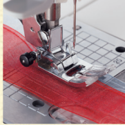
極薄物もぬい縮みなし

ぬいの核となる釜、天秤、針棒、送りのバランスを見直し、送り歯を水平に保ちながら布を送ることでぬい縮みや布ズレに対し効果を発揮します。また直進性や生地へのぬい始めなど快適なぬい心地を実現します。