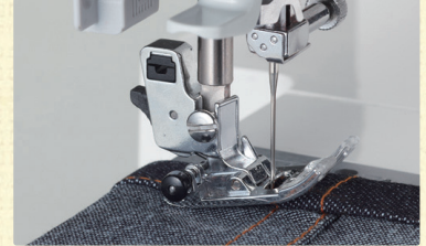
デニムの3つ折り伏せぬい

押えの構造を改良したことで送り力が大幅に向上しました。従来では難しかった折り目が重なった裾上げなどの極度な段部も難なく乗り越えることができます。