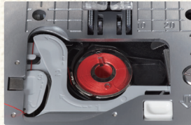
ガイドに沿って糸かけするだけです。