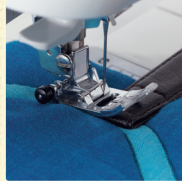
分厚いバッグの取っ手もぬい詰まりなし