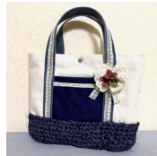
「薄地の裏付き帆布バッグも、少し糸かけを変えれば糸調子が合う」

「今も家庭用ミシンは愛用していますが、趣味のキャンプ用品などで革を縫いたくて、職業用ミシンを買いました。使ってみて感動したのは、700EXは糸調子を合わせる手間がほぼからないこと。それに職業用だからアタッチメントや針の種類が豊富。やりたいことが何でもラクに早く、きれいにできてうれしいです。革はもちろんデニムや帆布、いろいろな素材で、ホームソーイングを楽しんでいます」