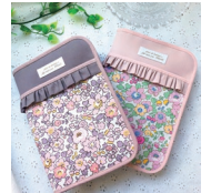
「生地が重なる端処理もバイアステープが美しく縫いつけられます」