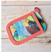
「キャンパスと帆布の本体&緑は本革テープなど、超厚手でも安心」