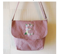
「キャンパス地で肩ひもが分厚くなくても、スムーズに縫えました」