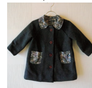
「衿を縫う際、厚みによるズレが心配でしたが、きれいな仕上がりに」

「家庭用ミシンで布小物などを作るうち、よりきれいに仕上げたい、大物作品に挑戦したいと思うように。職業用は糸調子やメンテナンス、音が心配でしたが、手芸店に相談したら、JUKIは故障が少なく700EXなら糸調子も簡単、と。インスタグラムでユーザーさんが仕上がりを絶賛されていたのもあり、決めました。いざ使ったら操作は簡単で音も気にならず、縫い目は抜群にきれいで大満足しています」