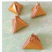
「家庭用ミシンでは縫い目がガタつく合皮も、しっかり縫えます」

「帆布などを縫う機会がふえ、家庭用ミシンでは針が折れたり縫い目が飛んだり…。パワーのある700EXに憧れていたものの、糸交換や糸調子、お手入れが不安で1年ほど悩みました。それをあるときミシン屋さんに相談したら、スッキリ解消できたんです。憧れの職業用ミシンは糸かけやお手入れが思ったより簡単で、とにかく縫い目がきれいで、縫う速度も速く、いいことずくめです。今後は革製品も縫ってみたいです」