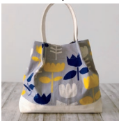
「持ち手が分厚く、家庭用ミシンでは難しかった帆布作品もスイスイ」