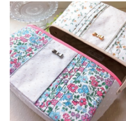
「タックで布が重なる部分のステッチも安定した目幅で縫えました」

「家庭用・工業用ミシンは使ったことがあるけれど、職業用ミシンはほぼ未経験でした。ただ作品を作るスピードが上がるにつれ、家庭用より縫い目が安定して美しく、工業用より軽くて扱いやすいミシンが欲しくなりました。いざ使ったら、やはり表裏共に縫い目が美しく、薄物から厚物まで糸調子の合わせも難しい。買ってよかった！と思いました。機能がシンプルなので、実は初心者さんも簡単に縫えますよ」