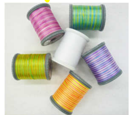
マルチカラー糸セット

日頃の感謝を込めて、 JUKIミシンのフォロワー限定で マルチカラー糸セットをプレゼント!