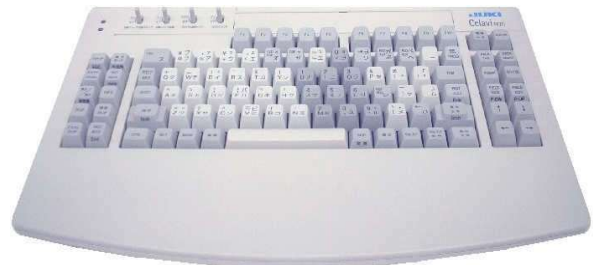
専用キーボード(029配列)

弊社エントリーソフト「Celavi i-Wiz」で使用しているもので、軽いキータッチと優れた耐久性を持っております。 元来、2タッチ連想入力方式は、カードパンチマシンのキーボード配列(いわゆる029配列)に合わせて考案されたものです。 内部の基板、搭載部品は環境に配慮した設計となっております。 (RoHS 指令対応)